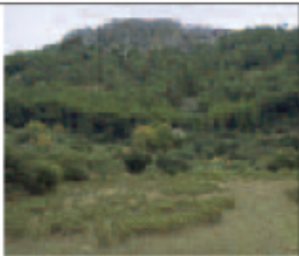
Visita del Tajo del Sol

el bosque nos llevará a la fuente del Rosal. A partir de este punto hay que prestar atención a las señales visuales de la ruta, que continúa ascendiendo atravesando los montes del Espinar y la Rosa. En Cerro Prieto, haciendo honor a su nombre, atravesaremos la masa forestal más densa y en mejor estado del municipio, por un camino casi sin uso, excepto el que le dan los cazadores. Al dejar atrás el bosque buscaremos la fuente del Rosal, en la que podemos refrescarnos, y continuaremos por la cañada real del Gallego hasta el cortijo de la Rosilla. Aquí tomaremos un camino que discurre entre el Lagunazo (1.276 m) y el Tajo del Sol (1.258 m), nuestro último objetivo. Desde su mirador podremos visualizar una amplia panorámica de las sierras y vegas de Granada, y tras haber repuesto fuerzas, desandaremos el camino sobre nuestros pasos. Tras pasar por el pinar que nos dio la bienvenida a la sierra de Madrid, descenderemos por una senda situada en el lado derecho, en la que las marcas visuales se sitúan en los troncos y en las piedras. Tenemos dos opciones de regreso: una que llega directamente a Fuente Alta y otra que bordea los pinares de la sierra de Madrid hasta el cortijo de la Fuente de Madrid, donde hay otra excelente fuente.