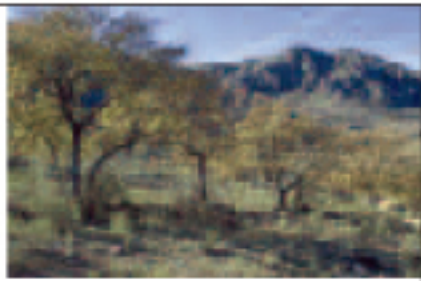
Vista otoñal de las cumbres de Parapanda

Partiremos desde la fuente de las Rozuelas, situada en el Km 6,4 de la carretera de Montefrío, en dirección al repetidor por la antigua cañada real del Gallego. En el límite de los 1.350 m, el camino hace un giro cerrado y la pendiente se pronuncia. Dejaremos entonces la pista y atravesaremos una pequeña depresión, que tras subirla nos llevará por un sendero hasta las Fuentezuelas (un nacimiento con agua de calidad excepcional -foto a pie de página-). Dejaremos al lado derecho una característica alberca tradicional, y siempre bordeando la sierra, atravesaremos un terreno formado por dolinas y matorrales de espinares. Junto a unos viejos olmos muertos