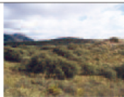
Paisaje en la Cuesta del Romero

un enorme pino en una mancha de monte que nos indicará que vamos bien encaminados. Seguiremos hasta conectar con el camino inicial que nos llevará de nuevo al principio de la ruta.