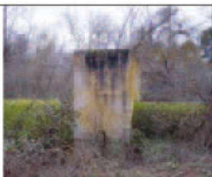
Otoño en la Presa

Algunos de los meandros del río Genil, a su paso por el municipio (en este caso por Brácana), conforman paisajes singulares y posiblemente, los bosques de ribera mejor conservados en la provincia de Granada. En estos bosques se pueden encontrar tarajes centenarios, fresnos, álamos y olmos, en un piso mesomediterráneo y sobre unos suelos yesíferos que los hacen más singulares si cabe. En ellos se conserva una rica y variada fauna, entre la que cabe destacar las tres especies de pícidos (pájaros carpinteros) de la provincia, las aves acuáticas como ánades, garzas reales, chorlitejos o cormoranes, así como mamíferos ligados a los medios acuáticos, como tejones, garduñas o lirones, mientras que junto a las vegas del Genil se puede observar al chotacabras pardo, al alcaraván y al avefría. Pero en este paraje destaca también la presa, con sus canales y sus aljibes. Este recorrido, por su tranquilidad y por adentrarse dentro de un perfil llano, es de los más placenteros de la zona. La época más recomendada para realizar la ruta es el otoño, ya que los brillantes colores del bosque nos sumergen en el recorrido.