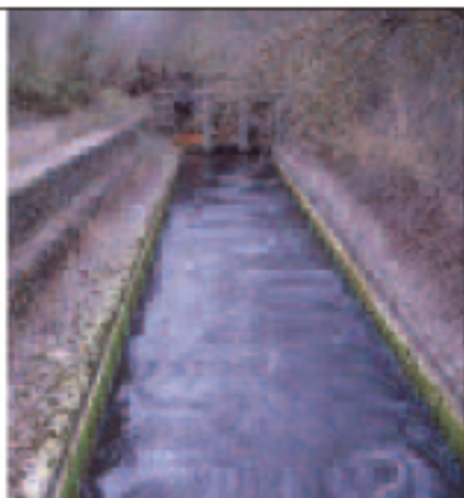
Canal de la Presa

Partiendo de Brácana, tomaremos el primer camino a la derecha en dirección a la autovía. Caminaremos un par de kilómetros, atravesando la vega del Hoyo de Juan Serrano, y dejaremos a nuestra derecha una loma donde se encuentra la torre de la Encantada, antigua atalaya nazarí. Seguiremos el camino en dirección al cortijo Turilla, junto al que veremos unas balsas de riego en el lado izquierdo del camino. Una vez rebasado el cortijo, atravesaremos el arroyo de Tocón y continuaremos junto al río en dirección al cerro Colorado. Aquí observaremos un transformador eléctrico donde se inicia una nueva ruta señalizada por el tramo de Villanueva. En este punto podremos observar la presa con sus canales, aljibes y toda la placidez que encierra el entorno. Tras disfrutar del espectáculo, emprendaremos la vuelta, volviendo sobre nuestros pasos. Seguro que no quedamos indiferentes.